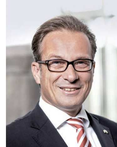
Reiner Breuer Bürgermeister der Stadt Neuss