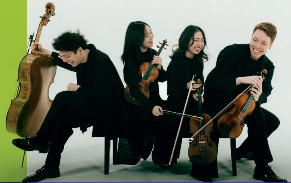
Leonkoro Quartet